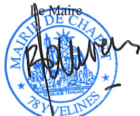
Benoît de LAURENS